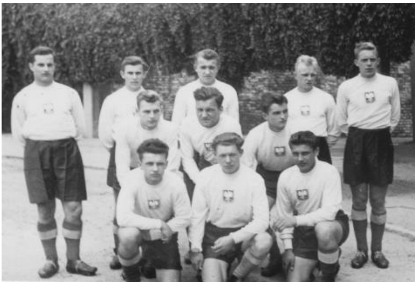
Mistrz Polski Unia Racibórz 1954