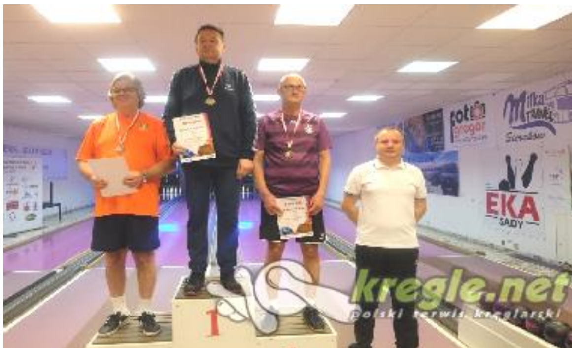
I Indywidualne Mistrzostwa Polski Seniorów U 60 18 – 19. 06. 2019 r. Sieraków