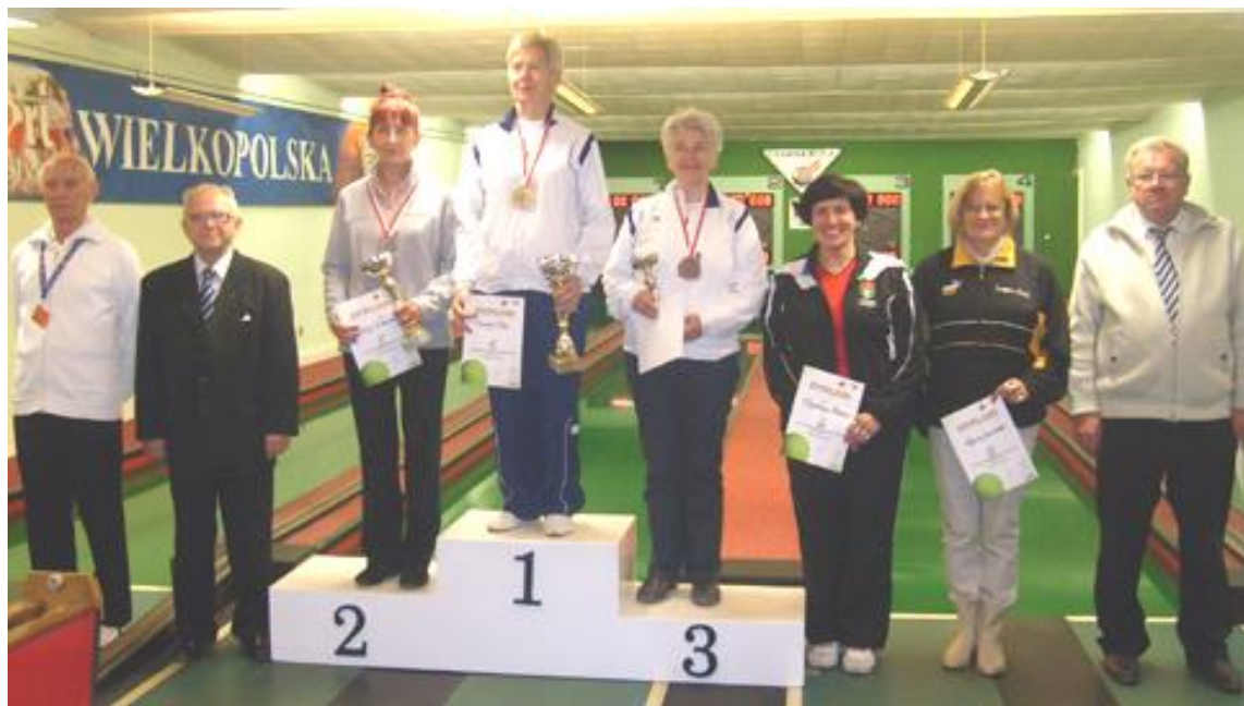
Mistrzostwa Polski Seniorów „A” / Seniorki / 16 – 18. 06. 2014 r. Czarna Kula - Poznań