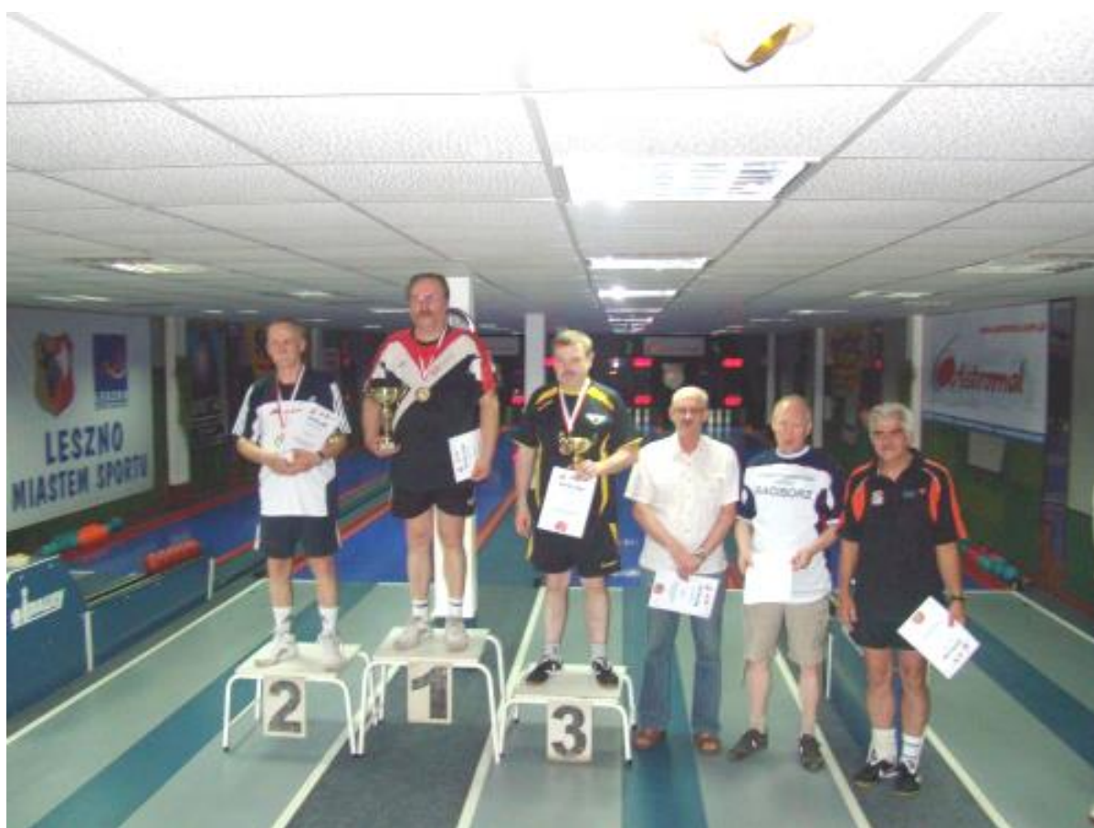
XVI Indywidualne Mistrzostwa Polski Seniorów „A” Leszno 21 – 22. 05. 2011 r.