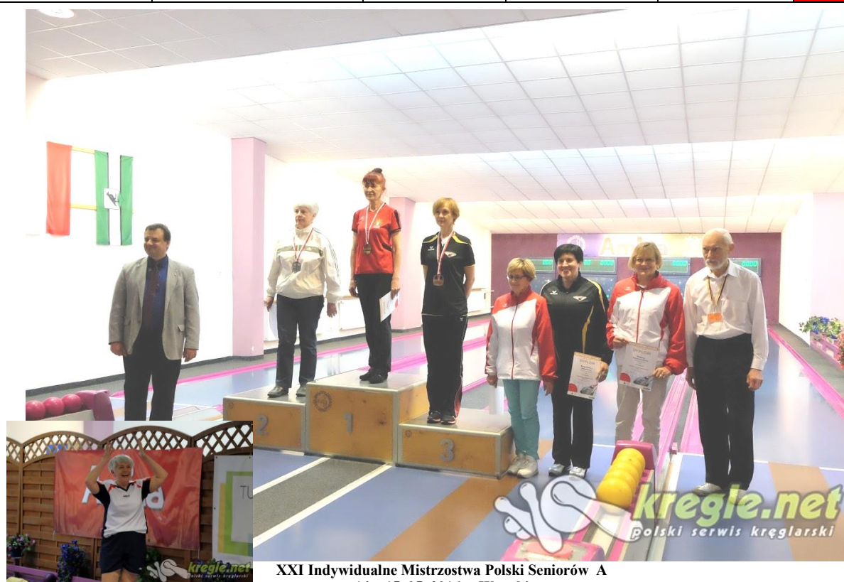
XXI Indywidualne Mistrzostwa Polski Seniorów A 14 – 15. 05. 2016 r. Wronki