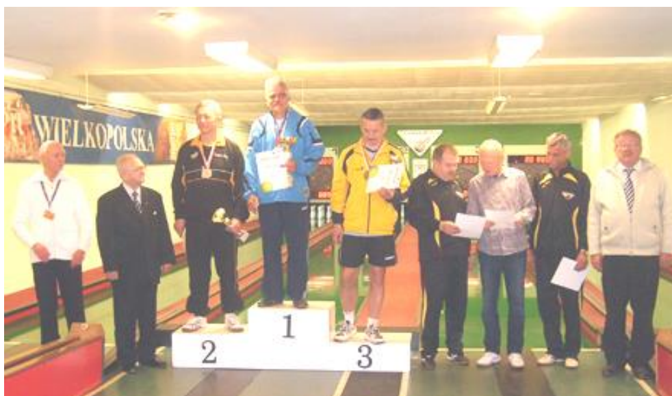
XIX Indywidualne Mistrzostwa Polski Seniorów „A” / Seniorzy / 16 – 18. 06. 2014 r. Czarna Kula - Poznań