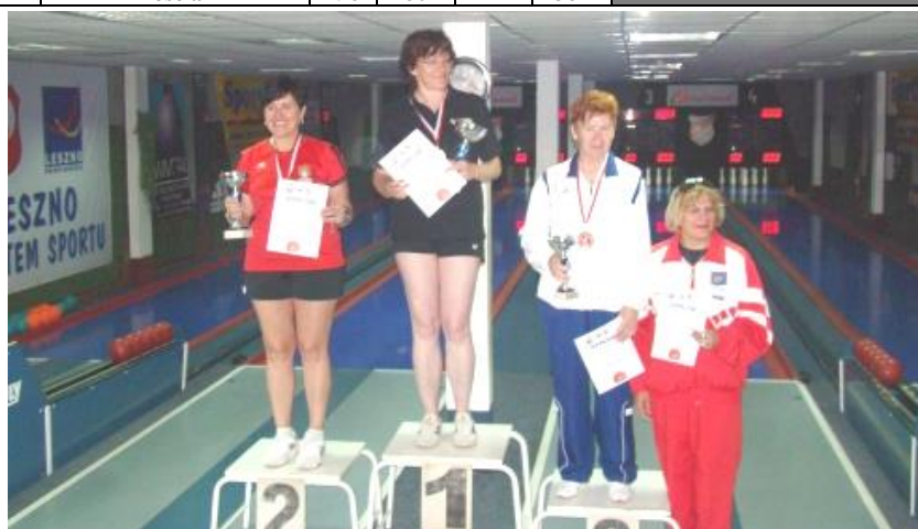
XVI Indywidualne Mistrzostwa Polski Seniorów „A”