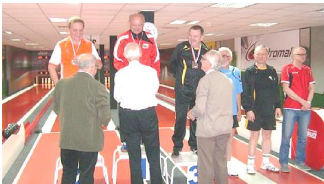
XX Indywidualne Mistrzostwa Polski Seniorów „A” 16 – 17. 05. 2015 r. Leszno