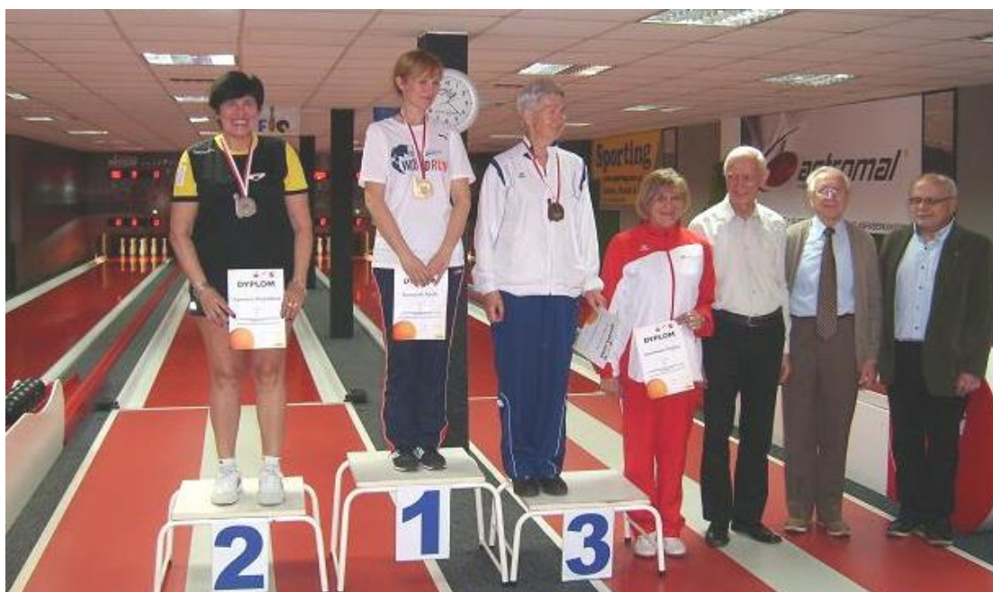
XX Indywidualne Mistrzostwa Polski Seniorów „A” / Seniorki / Leszno 16 – 17. 05. 2015 r.