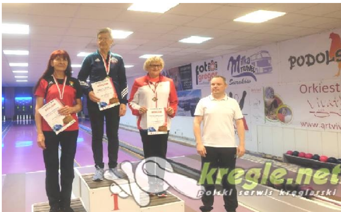
I Indywidualne Mistrzostwa Polski Seniorów – seniorki U 60 18 – 19. 06. 2019 r. Sieraków