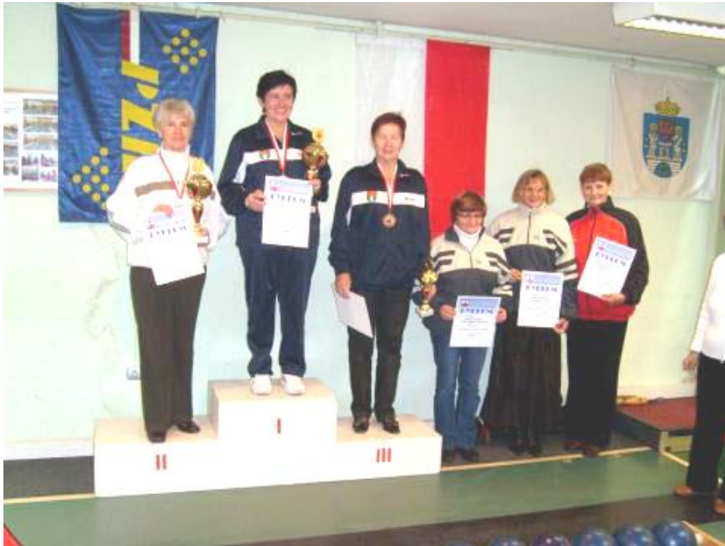
Leszno 17 – 18. 10. 2009 r.