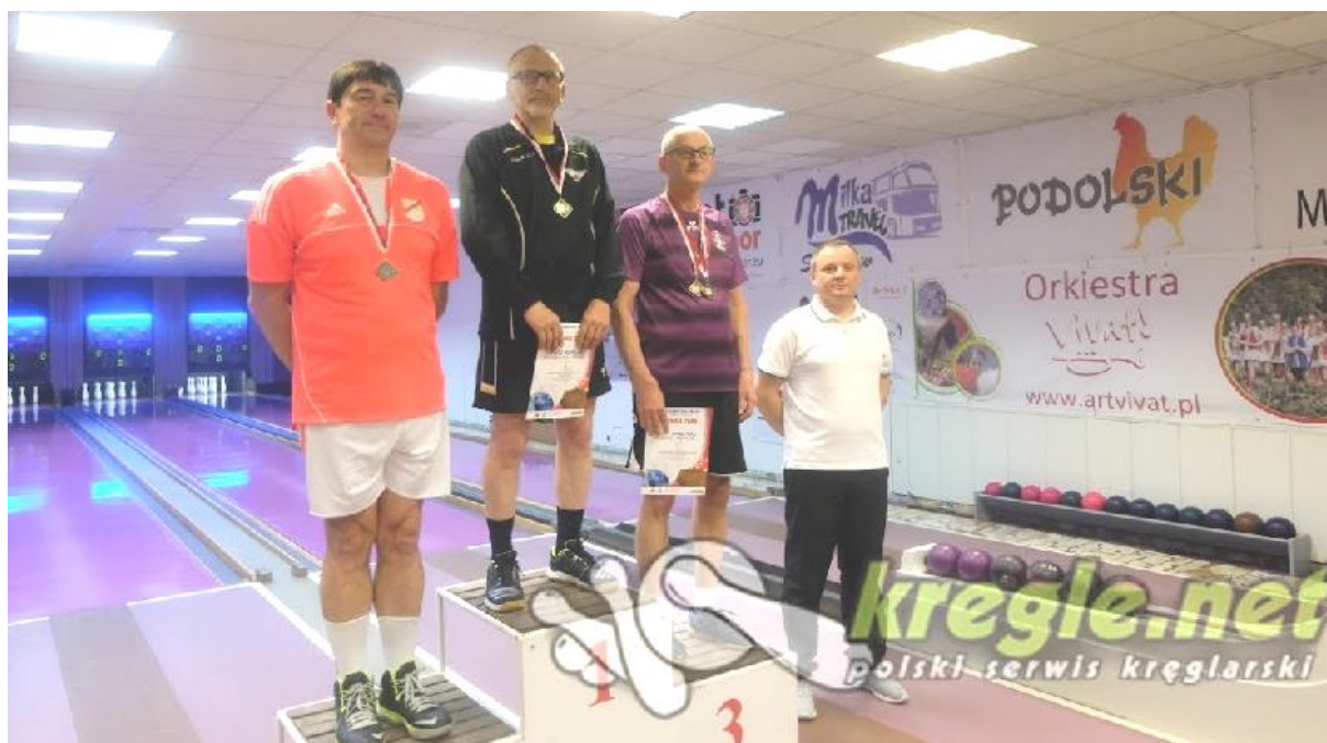
XXIV Indywidualne Mistrzostwa Polski Seniorów A – seniorzy U 50 18 – 19. 06. 2019 r. Sieraków