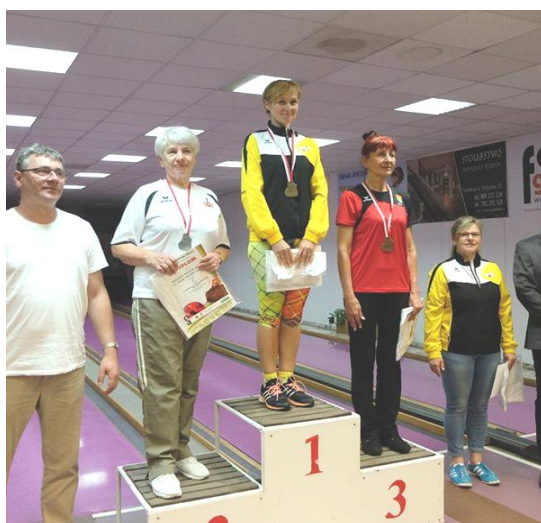
XXIII Indywidualne Mistrzostwa Polski Seniorów A 12 – 13. 05. 2015 r. Sieraków Kategoria – kobiety