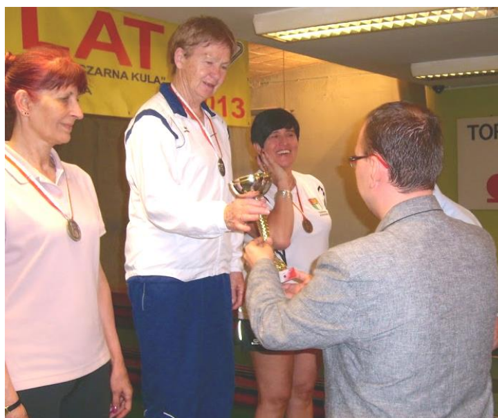
XVIII Indywidualne Mistrzostwa Polski Seniorów A / Seniorki / 18 – 19. 06. 2013 r. Poznań