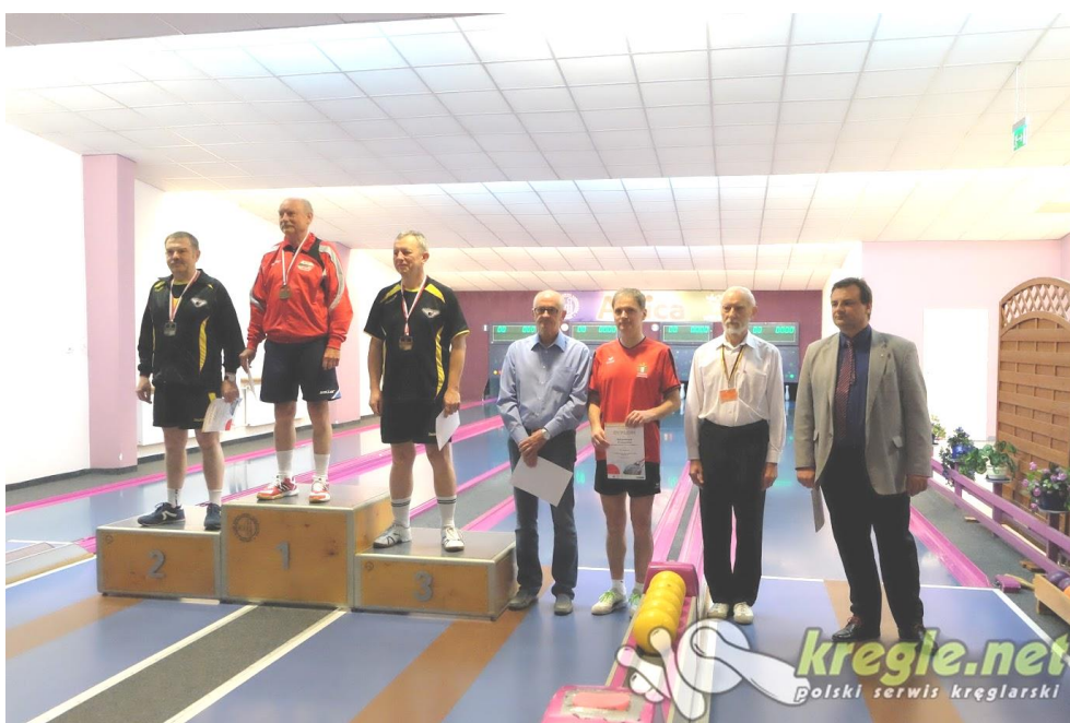
XXI Indywidualne Mistrzostwa Polski Seniorów A 14 – 15. 05. 2016 r. Wronki