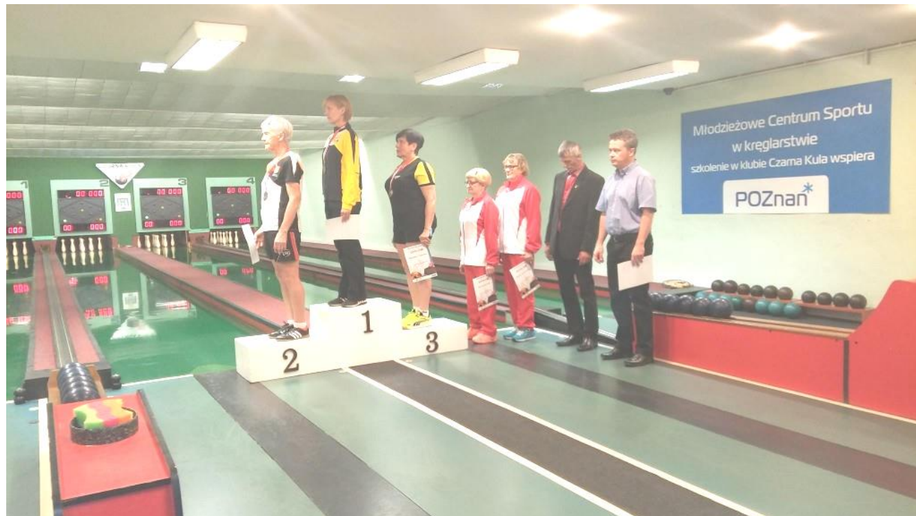
XXII Indywidualne Mistrzostwa Polski Seniorów A 18 – 21. 05. 2017 r. Czarna Kula Poznań Kategoria - seniorki