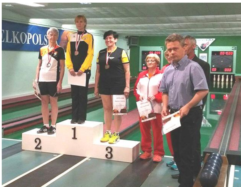
XXII Indywidualne Mistrzostwa Polski Seniorów A 18 – 21. 05. 2017 r. Czarna Kula Poznań Kategoria - seniorki