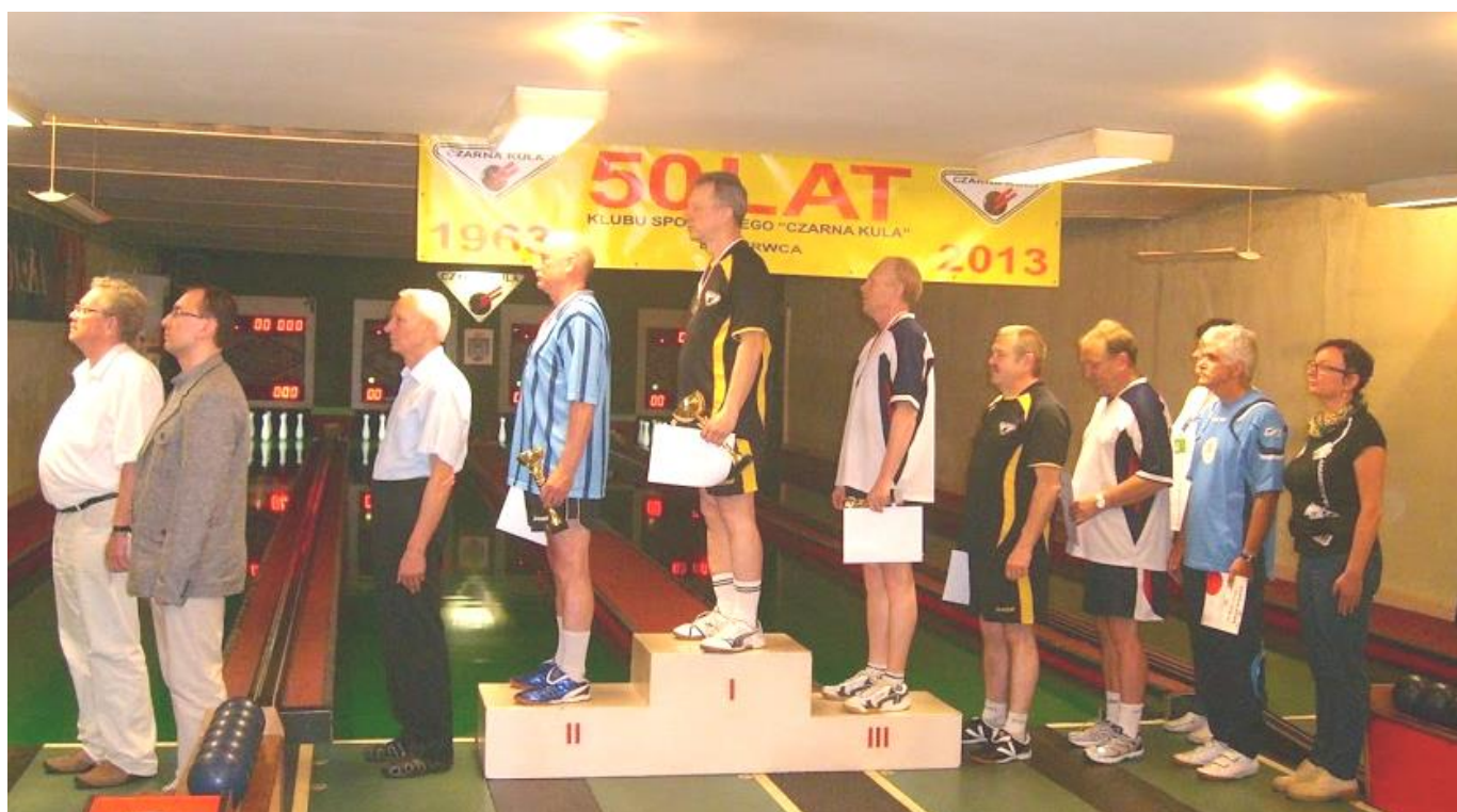
XVIII Indywidualne Mistrzostwa Polski Seniorów „A” - seniorzy 18 – 19. 06. 2013 r. Poznań