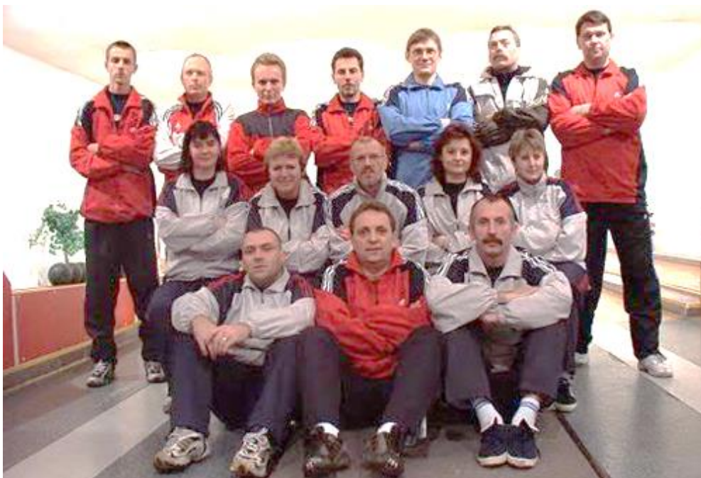
Na zdjęciu Raciborskie Stowarzyszenie Kręgli Klasycznych / 2005 /