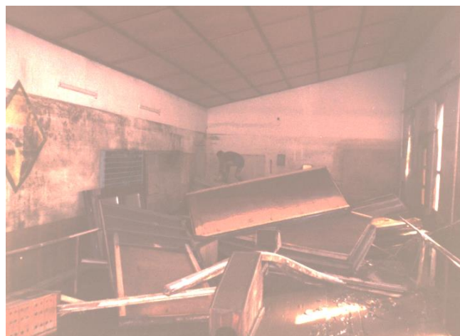
Na zdjęciach: Stara kręgielnia przed i po powodzi