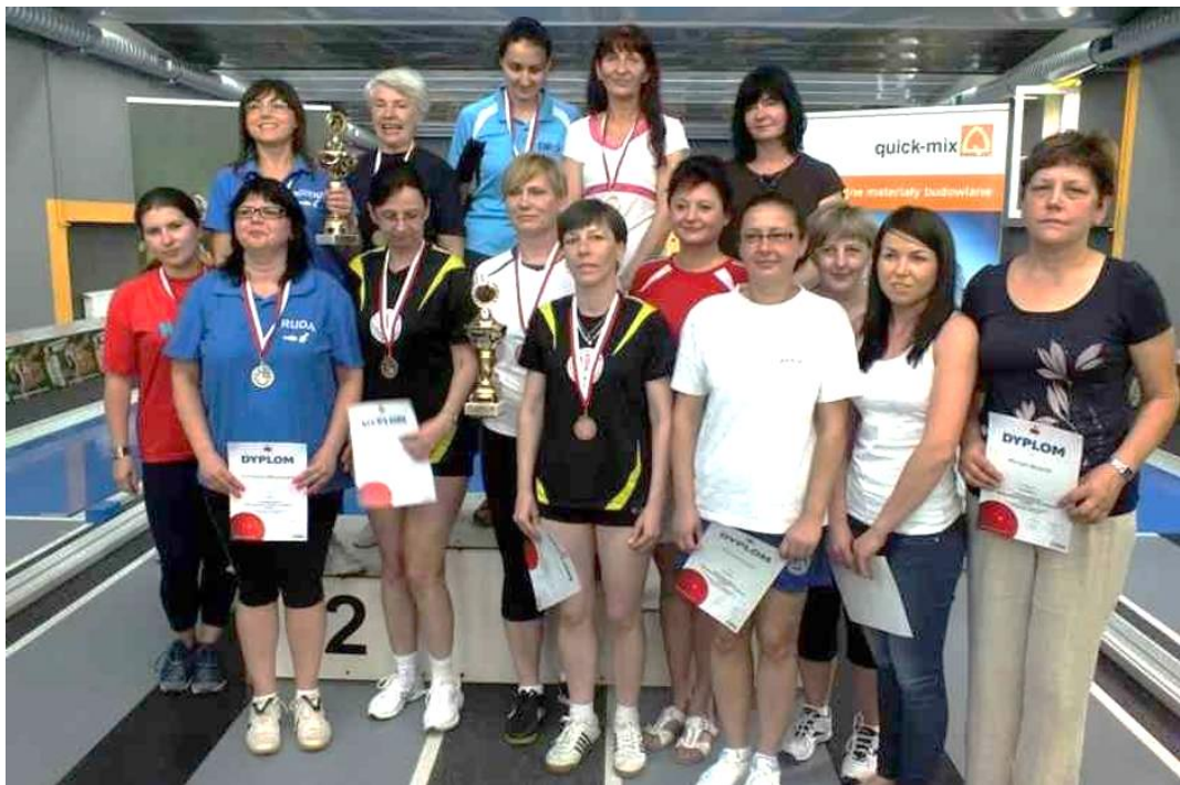
Na zdjęciach dekoracja zwycięzców