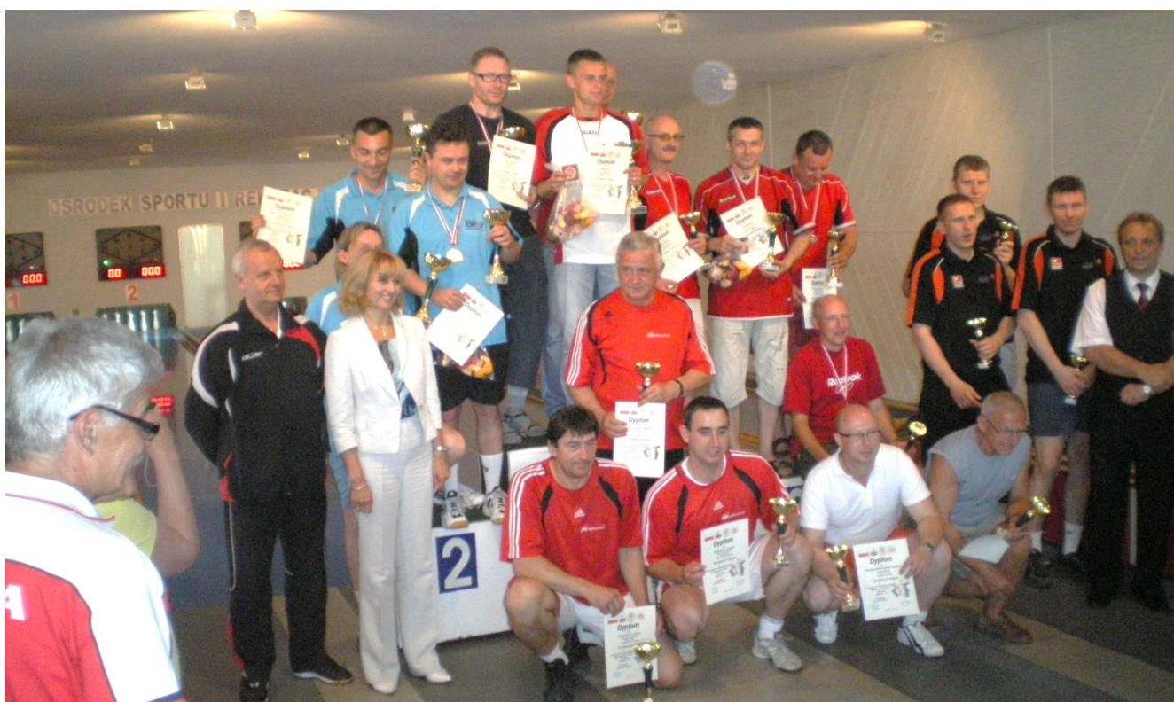
Na zdjęciach Dekoracja najlepszych drużyn żeńskich i męskich