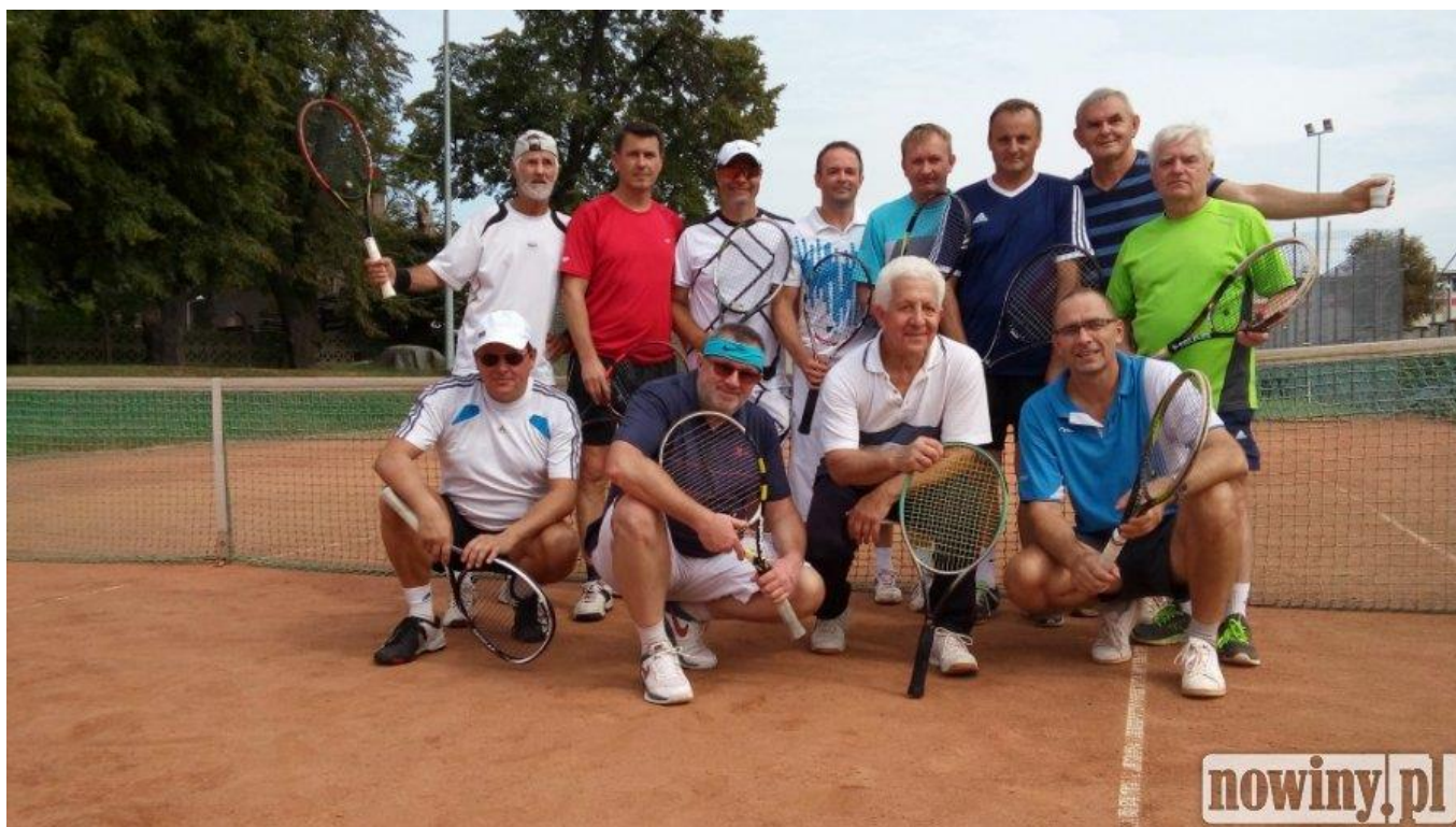
Na zdjęciach Amatorska Liga Tenisa Ziarnego na kortach OSiR /2016 /